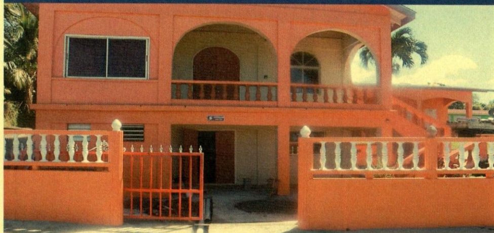
REFUGIO CONTRA HURACANES SALEM (PRIMER PISO)

Los ocupantes deben seguir las instrucciones de COVID-19, emitidas por el gerente de refugio en relación con el distanciamiento social y la higiene adecuada en los refugios. Además, se identificarán refugios adicionales, si se considera necesario.