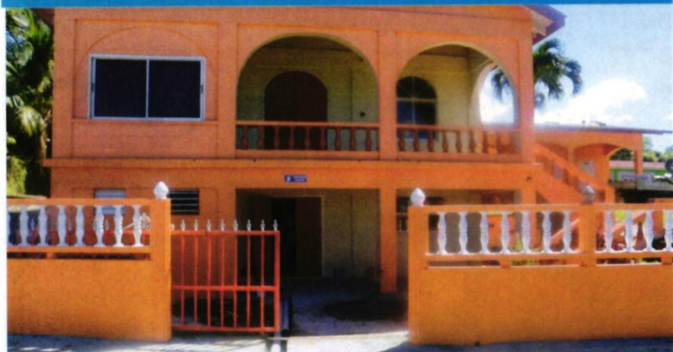
REFUGIO CONTRA HURACANES SALEM (PRIMER PISO)

No se admiten mascotas en los refugios. Se abrirán refugios adicionales si es necesario.